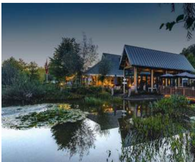
Kampkuiper te Harbrinkhoek