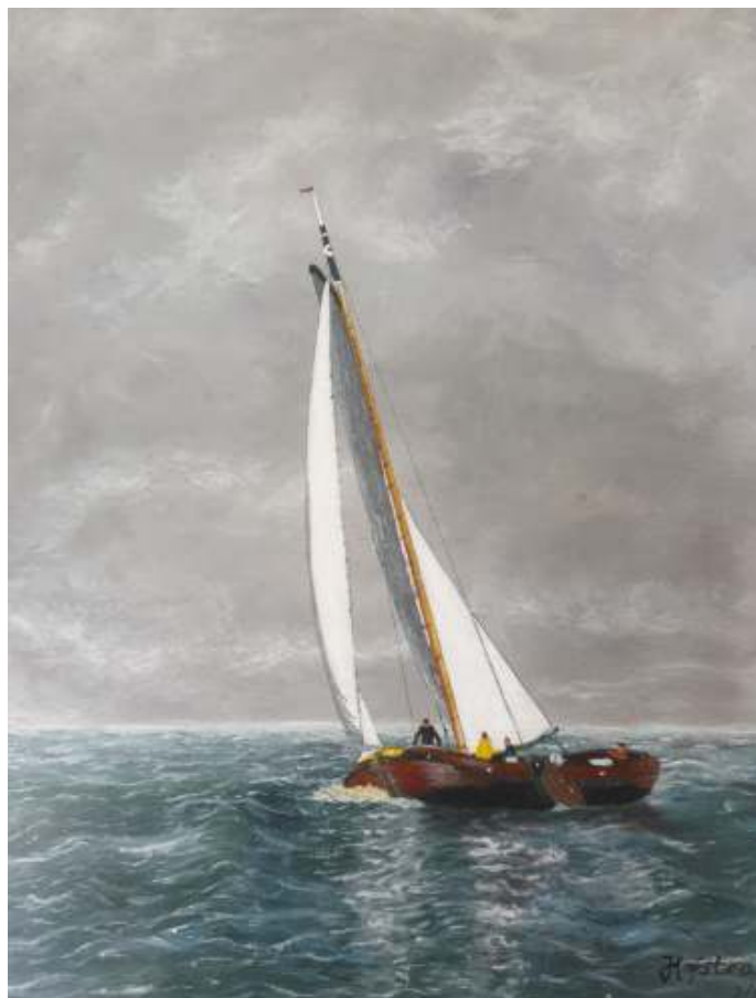
Schilderij Lemster Aak (gemaakt door Jaap Hofstra)