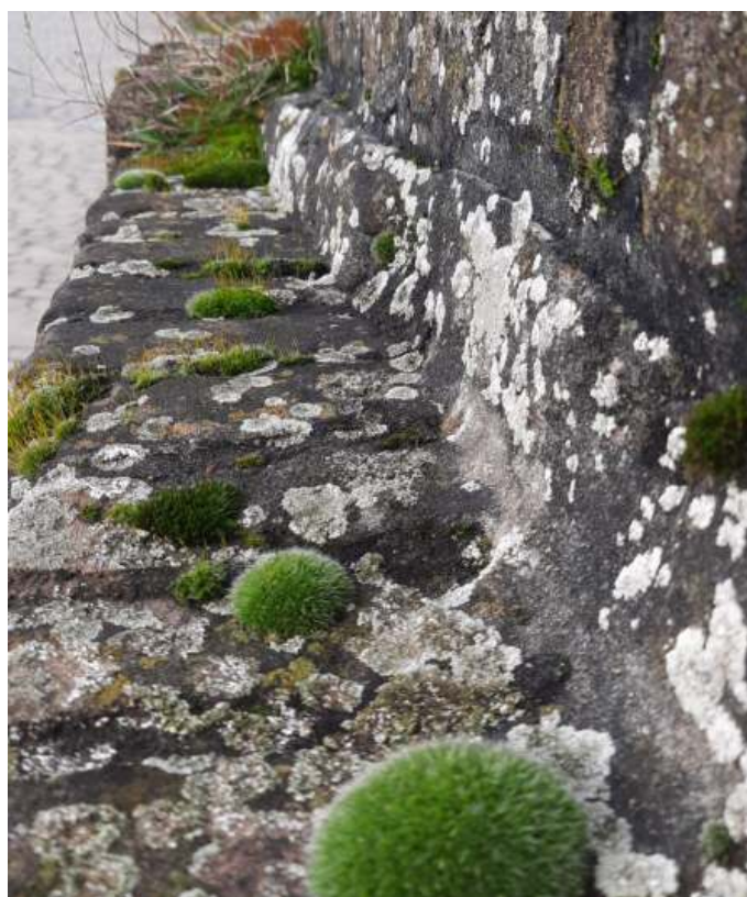
Gewoon muisjesmos (Grimmia Pulvinata)

Soms vindt men op tuinmuurtjes, trottoirtegels en stenen schuttingen ook in de winter een rossig "vachtje" van muurmossen. Muurmossen zijn maar heel kleine nietige plantjes die samen kussentjes vormen. Muurmossen zijn sporenplanten en zij dragen dus geen bloemen. Toch lijkt het net alsof ze het hele jaar door in bloei staan, omdat de gesteelde, roodbruine sporenkapsels heel lang aan de plantjes blijven zitten.