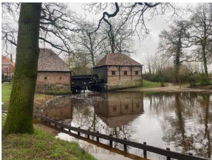
De Watermölle te Haaksbergen